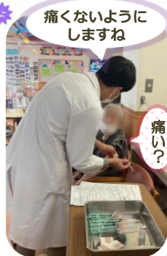
痛くないようにしますね

入所者様の4回目接種が7月よりスタートし、大きな副作用もなく無事に終わることが出来ました。今後も施設内感染を防ぐよう注力してまいります。