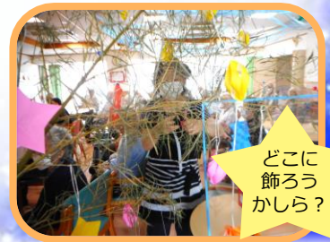
どこに飾ろうかしら？